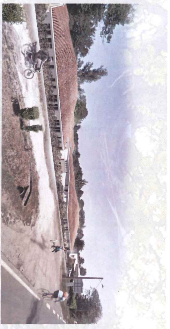
A - Vue depuis la route de bordeaux