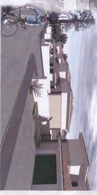
B - Vue du passage Magnan