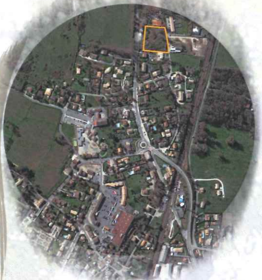
Localisation du terrain