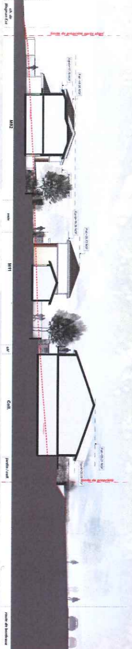
Coupe transversale Est 1/200