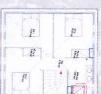
1 er Étage