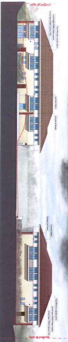
Façade Type Collectif Nord 1/200