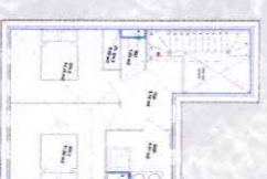
1 er Étage