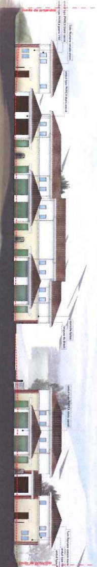
Façade Type Maison Nord 1/200