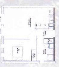
1 er Étage