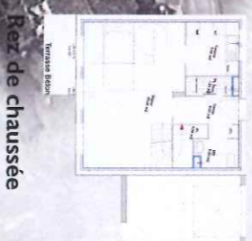
Rez de chaussée